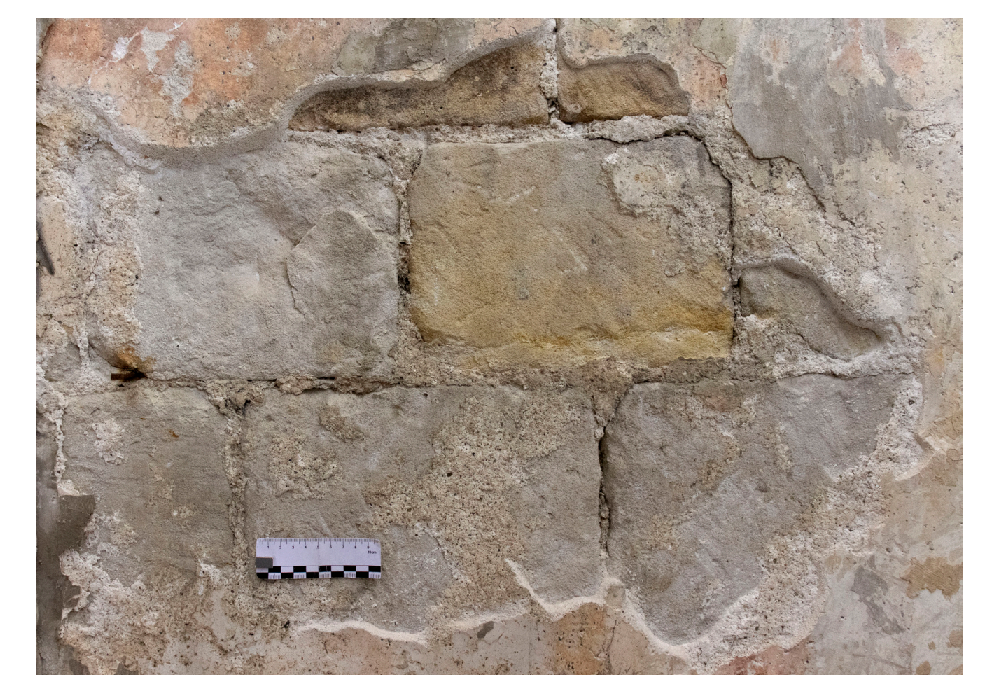
Fehlstellenbereich nach ausgeführten Notsicherungen: Reinigung, Randsicherung und Hinterfüllmaßnahmen.