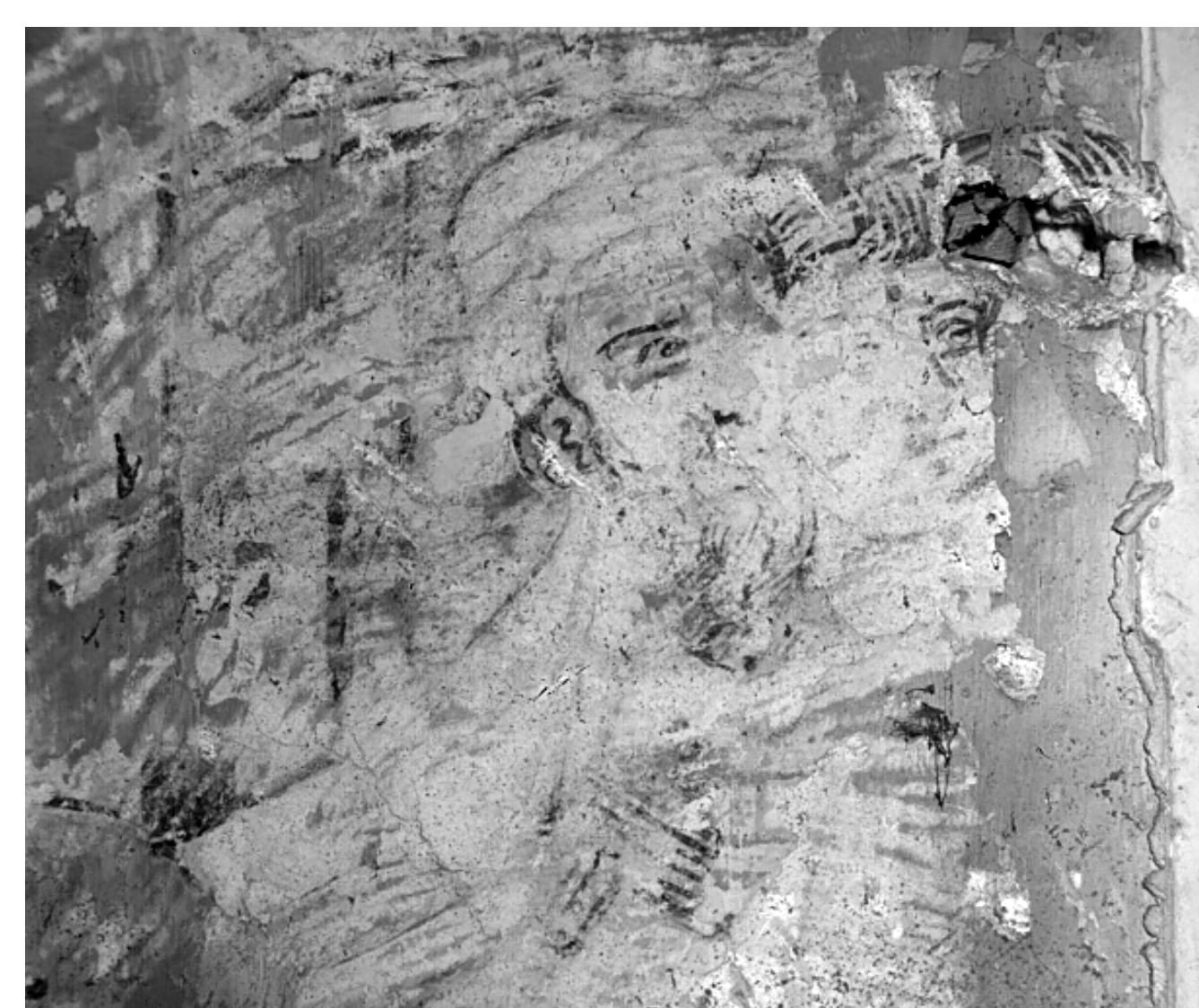
IRR-Detaillaufnahme einer Bildszene im oberen Register der Südwand. Die sorgfältig ausgeführten Unterzeichnungen werden hierbei deutlich.

Die Archivrecherche stärkt die Vermutung, dass bis Anfang des 20. Jh. zumindest noch im Osten des nördlichen Seitenschiffes sowie in den angrenzenden Wandflächen um den heute sichtbaren Wandmalereibereich zugehörige Gestaltungen existiert haben.