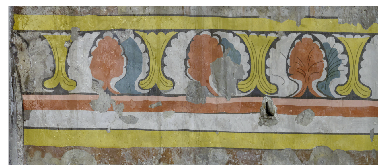
Befundmodell des oberen Palmettenfrieses der Ostwand; zeigt den Farbrapport mit der ursprünglichen blauen Farbigkeit des Pigmentes Vivianit.

Das Wandbild erfuhr in der Vergangenheit zudem keine großartigen Überarbeitungen im Sinne von Rekonstruktionen oder Restaurierungen, wie entsprechende Untersuchungen und die Quellenrecherchen zeigten. Das Wandbild stellt folglich die einzige – in diesem Umfang erhaltene – zusammengehörige Wandgestaltung der frühen Bauperiode dieser Kirche dar und bildet somit ein authentisches Zeugnis seiner Entstehungszeit und Geschichte.