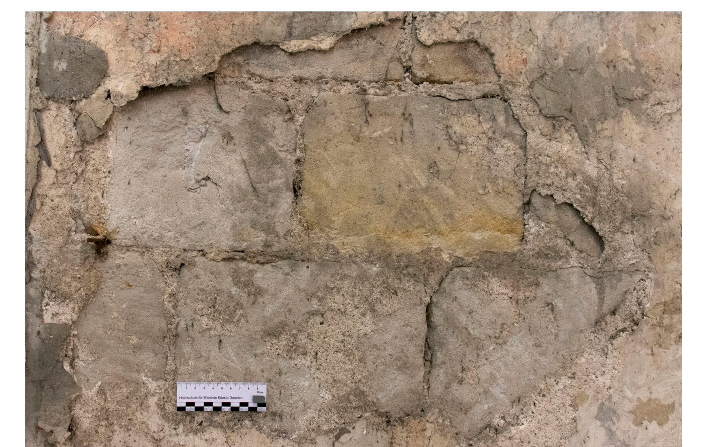
Vorzustand der große Fehlstelle im oberen Register der Ostwand mit fragilen und teils hohl liegenden Putzflanken.