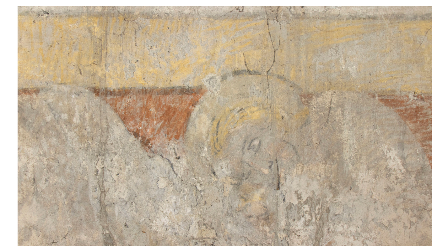
Detail der Malerei: Konzept des Illusionismus durch überschneidende Darstellungen über die Bildfeldgrenzen hinaus.

Zu den hauptsächlichsten Schadensbildern zählen: lose, teils hohl liegende Putzflanken und -schollen um Risse und Fehlstellen; Malschichtablösungen und punktuelle Fehlstellen; kreiende und bereits reduzierte Malschichten sowie lose oder eingebundene starke Schmutzaufgaben.