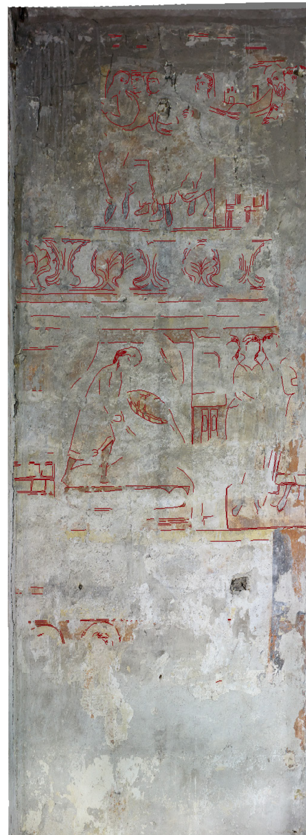
Das Wandbild an der Süd-Ost-Wand des südlichen Seitenschiffes der St. Aegidii-Kirche mit angefertigter Umrisszeichnung von erhaltenen Formen der Bildkomposition der ersten frühgotischen polychromen Fassung des 13./14. Jh. (Quellen: Messbild, K. Riße; Umrisszeichnung in ArcMap10.1, R. Zeidler).