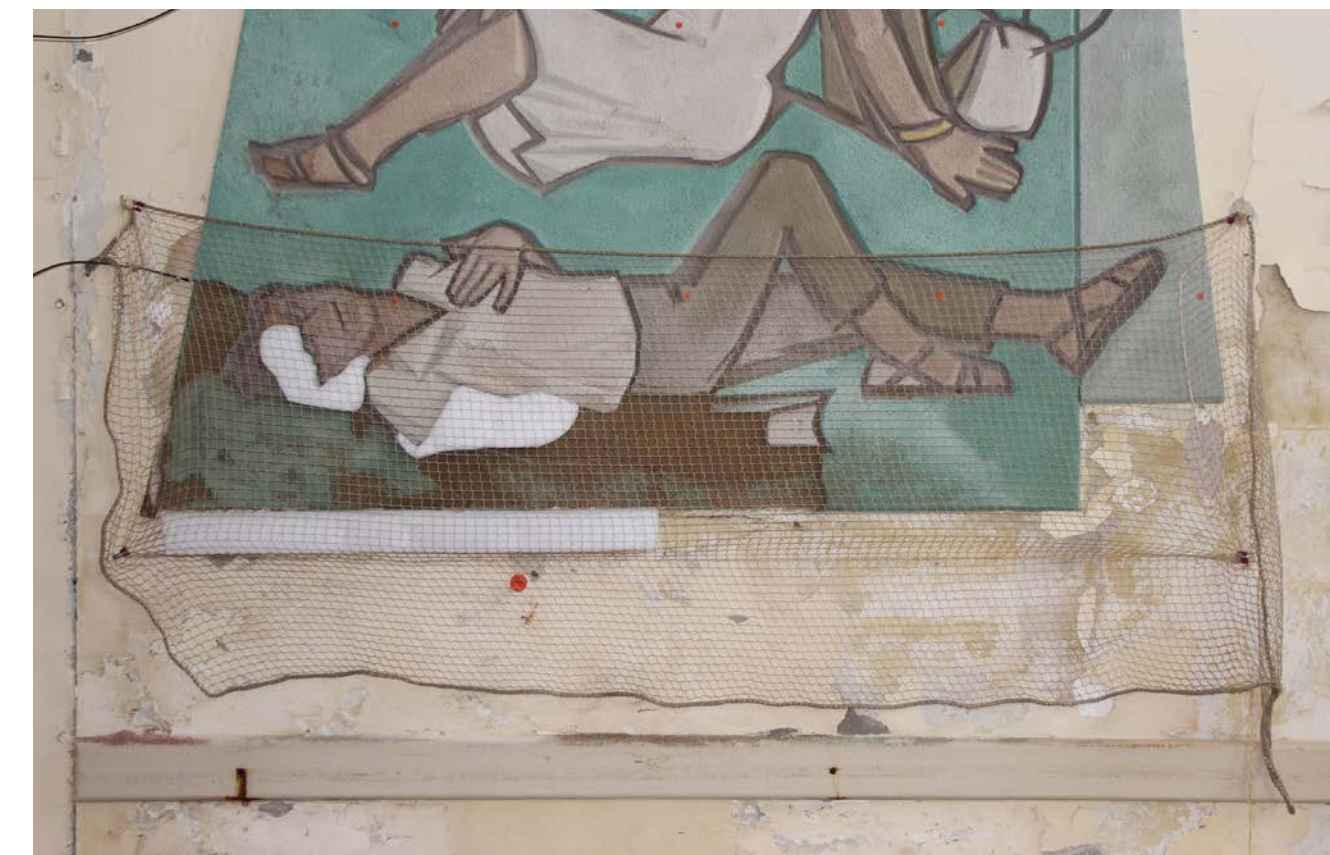
Übersicht der Notsicherung mit einem Netz und Stützstoff.

Notsicherung und Maßnahmen am Putzschnitt „Ruhe“ Über die kalten Wintermonate wurde der stark absturzgefährdete Bereich zunächst mit einem Netz und Stützmaterial notgesichert.