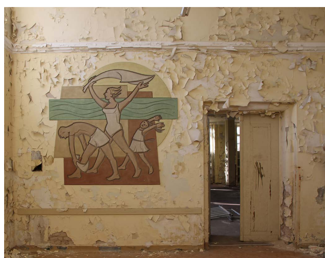
Übersicht der Süd-West-Wand mit dem Putzschnitt „Bewegung“.