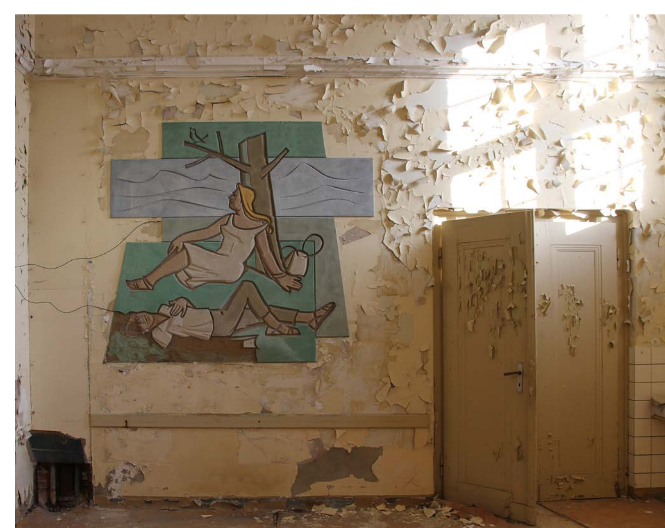
Übersicht der Nord-Ost-Wand mit dem Putzschnitt „Ruhe“.

Die beiden gegenüberliegenden Bilder präsentierten sich im Winter 2019/20, zur Zeit der ersten Diplomphase, in stark unterschiedlichen Zuständen. Während man von einem guten Allgemeinzustand des Putzschnittes „Bewegung“ ausgehen konnte, zeigte die „Ruhe“ Phänomene, die einen unmittelbaren Handlungsbedarf forderten. Durch massive Putzablösungen und eine stark strukturell entfestigte Putzsubstanz war ein unmittelbares Eingreifen notwendig, da weitere Putzverluste drohten.