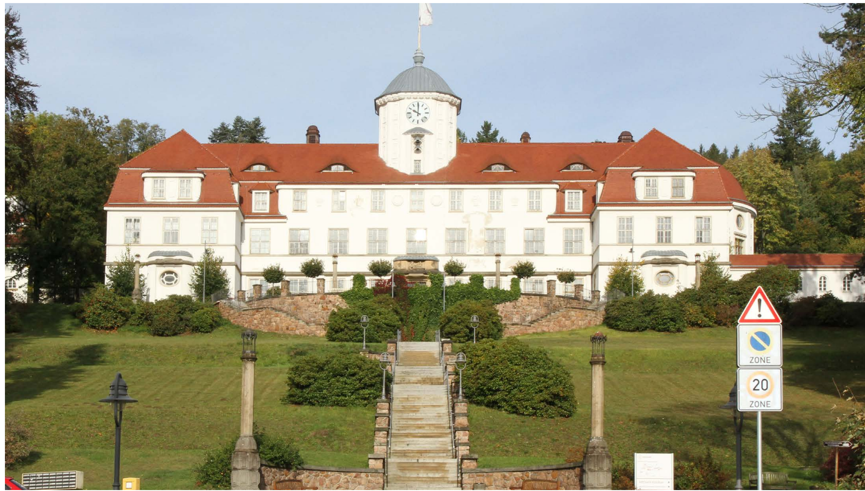
Blick vom Tal auf das schlossartige Kurmittelhaus zentral im Anlagenaufbau des Klinikgeländes, ausschließlich diese repräsentative Fassadenseite wurde noch saniert und steht im Kontrast zu dem Zustand im Innenraum und an den übrigen Fassadenseiten des Vierflügelbaus.

Auftraggeber Median Klinik Bad Gottleuba