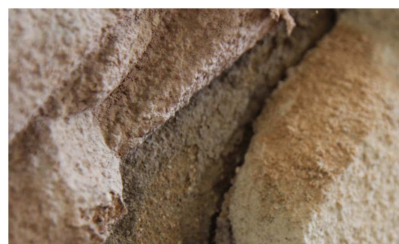
Detail der lagigen Putzablösung und Auflage von strukturentfestigten Putzmaterial auf den waagerechten Profilhöhen.

Da das Wandbild „Bewegung“ in einem guten Zustand ist und materialtechnisch sehr ähnlich zum anderen Wandbild, musste der schlechte Zustand der „Ruhe“ auf die Exposition im Raum zurückgeführt werden. Neben dem Wandbild „Ruhe“ wurde im Zuge der Schadursachenanalyse ein Rohrschacht lokalisiert. Die Situation vor Ort weist auf einen erheblichen Wassereintrag in der unteren Wandregion, unterhalb des Putzschnittes, als Folge eines Rohrlecks oder Rohrbruchs, hin. Dieses lokale Problem führte in Zusammenhang mit ungünstigen Begleitfaktoren nach der Schließung des Gebäudes und damit einhergehenden zunehmenden baulichen Mängeln und Klimaschwankungen zu bereits erheblichen Verlusten des Putzes.