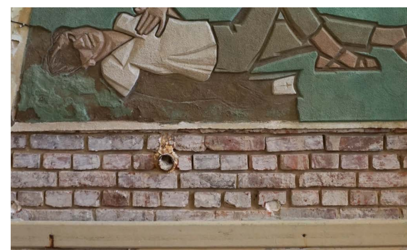
Mauerwerksfreilegung und Teilentfernung des Fugenmörtels unterhalb des Putzschnittes „Ruhe“.

Aufgrund des Schadbildes und der ehemaligen starken Durchfeuchtung des unteren Wandabschnittes der Süd-West-Wand wurde die Feuchte- und Salzbelastung am umliegenden Wandbereich durch das IDK Sachsen untersucht. Die Ergebnisse deuten durchaus auf eine Belastung der umliegenden Wände durch bauschädliche Salze hin, die auch als Effloreszenzen an verschiedenen Raumelementen in Erscheinung treten. Da die Putzschnitte selbst keine Ausblühsalze oder Gipskrusten zeigen, wurde auf direkte Entsalzungsmaßnahmen verzichtet. Eine indirekte Maßnahme, die Entkoppelung der Putzschnitte von dem Umgebungsputz im Sockelbereich, wurde indes ausgeführt. Dabei wurde der bauzeitliche Wandputz im Teilbereich unterhalb der Bilder entfernt und der Fugenmörtel beräumt. Dies soll die Bilder aufgrund der bis dato unklaren Nutzungssituation des Gebäudes auch präventiv schützen.