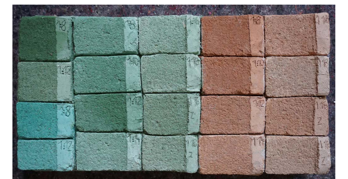
Probeplatte 1 mit durchgefärbten Putzen.

Da die momentane Gebäudesituation jedoch eine solche Maßnahme ausschließt, werden im Zuge der Diplomarbeit die theoretische Vorarbeit (in Form von Fehlstellenbewertung und ethischer Diskussion) und methodische Vorversuche geleistet. Auf Grundlage der theoretischen Vorüberlegungen wurde sich dazu entschlossen, eine Fehlstellenergänzung im jeweiligen Unterton zu erproben. Die Methode der Untertonerfüllung sollte in den Versuchen mit durchgefärbten Putzen und durch eine Lasur auf unpigmentierten Putzflächen erprobt werden. Dazu erfolgten zunächst Farbproben für eine geeignete Pigmentmischung.