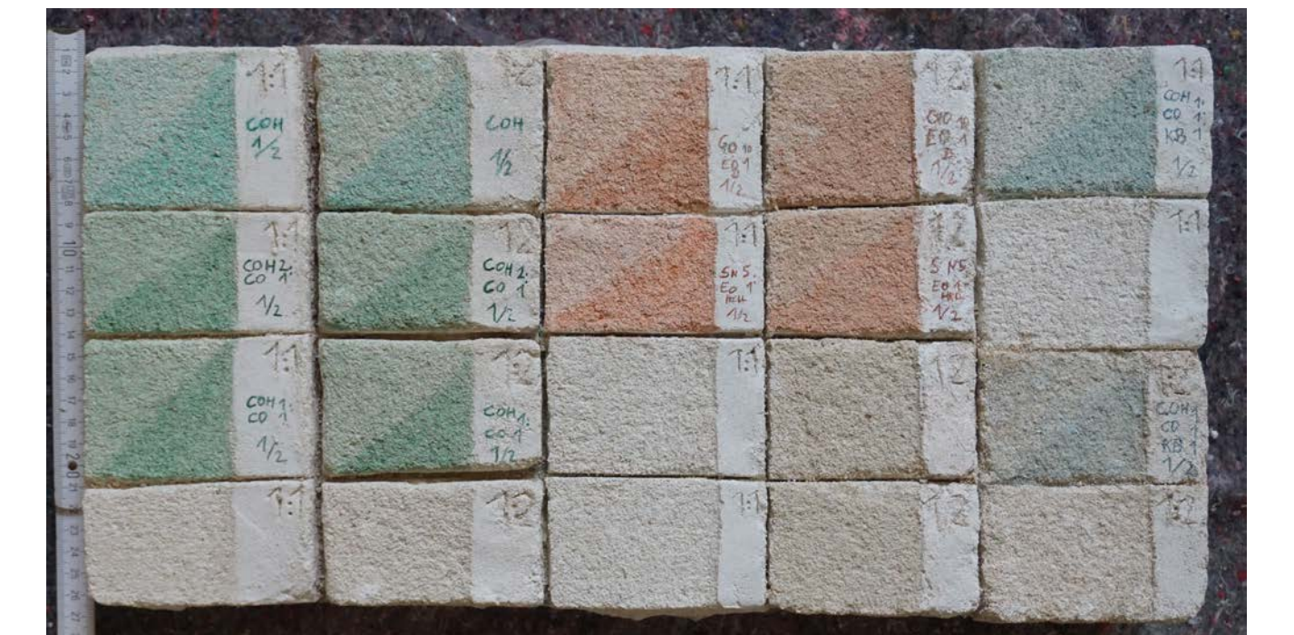
Probeplatte 2 mit unpigmentierten Kalkputzflächen, die mit einer Wasser-Pigment-Lasur gefasst wurden.

Die Methode der Pigment-Wasser-Lasur auf unpigmentierten Putz als Fehlstellenergänzung im Unterton erwies sich in den Vorversuchen als sehr gut praktikabel.