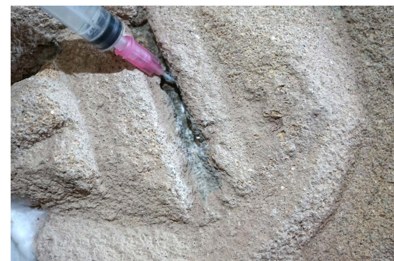
Detail der Hinterfüllmaßnahme mit flexibler Kanüle am Putzschnitt „Ruhe“.

Ab Frühjahr 2020 konnte das Notsicherungsnetz entfernt werden und die in der Testreihe ermittelten Konservierungsmaterialien eingebracht werden. Aufgrund der starken Profilierung mussten besonders schwierig zugängliche Stellen mit einer flexiblen Kanüle hinterfüllt werden.