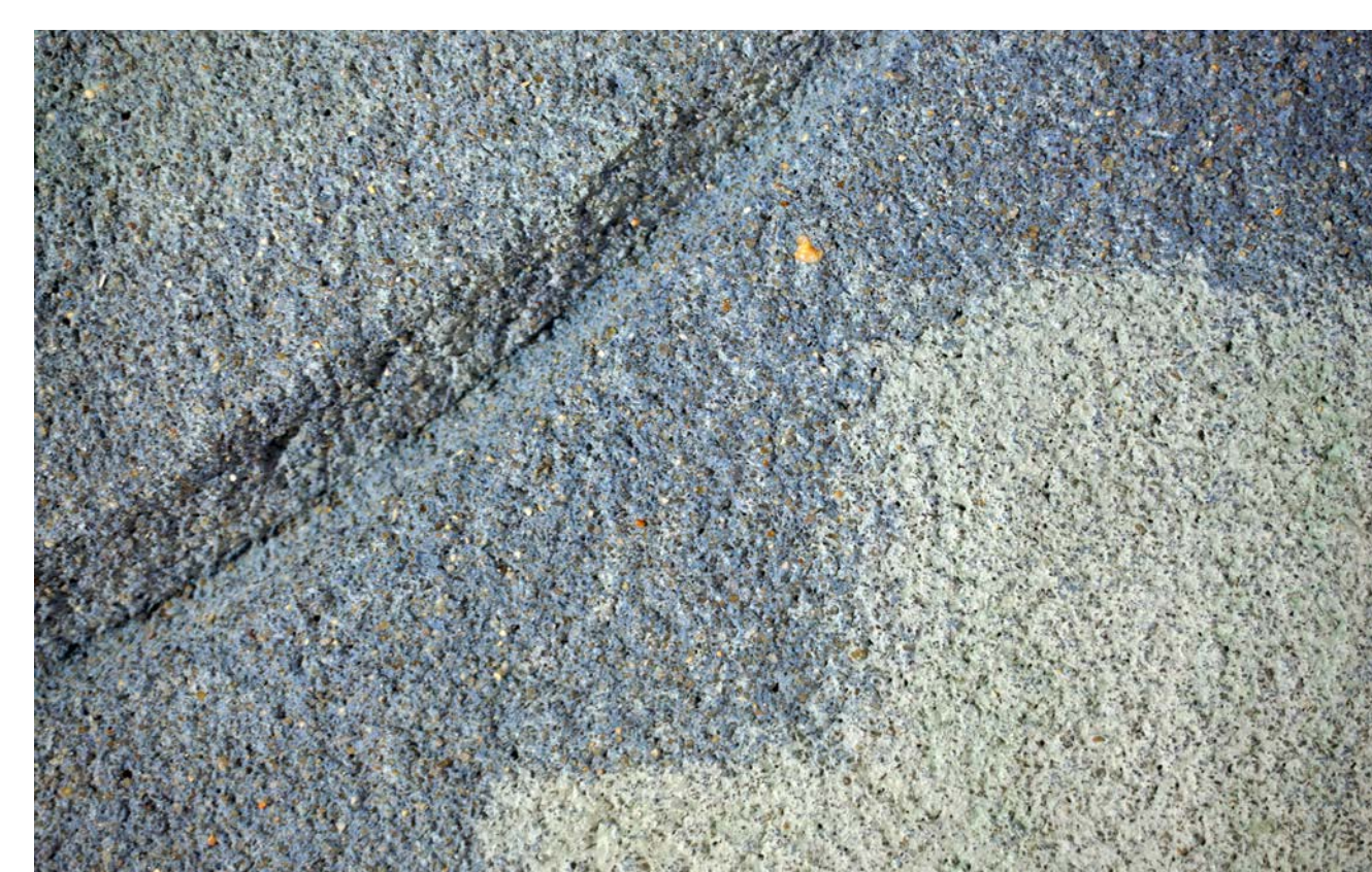
Detail: Schnitt freigelegte Putzoberfläche und Überfassung.

Von Frühjahr an bis September 2020 wurde die schädigende PVAC-Überfassung mittels Ethylacetat-Gel und in stabilen Bildbereichen zusätzlich mit Dampfstrahl, am Putzschnitt „Ruhe“ abgetragen.