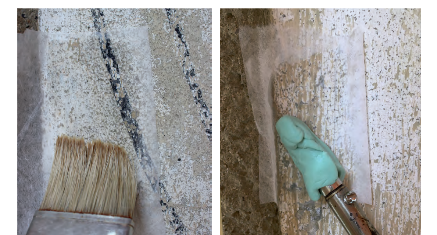
Abb. 6: Kohäsive Festigung der Fassung über Japanpapier. Abb. 7: Adhäsive Festigung konkav aufgewölbter Fassung mit Hilfe der Niederlegung mit einem Heizspachtel.

Die kohäsive Festigung der gesamten Fassung mit einer Kombination aus Tylose MH300 und Ludox PX30 in einem Verhältnis 3 RT + 1 RT. Das Festigungsmaterial wurde dabei mit einem Pinsel über Japanpapier in zwei Durchgängen auf die Fassung aufgetragen (Vgl.: Abb. 6). Für die adhäsive Festigung wurde eine Mischung aus Tylose MH1000 und Ludox PX30 mit einer Spritze unter die aufgewölbten Fassungsgebiete aufgetragen, die anschließend mit einem Heizspachtel über Japanpapier angelegt werden konnten.