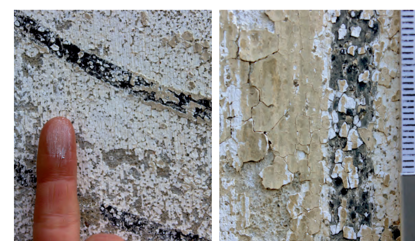
Abb. 4: Kohäsive Entfestigung der Fassung. Abb. 5: Konkav aufgewölbte Farbschichten.

Auf wechselnde Temperaturen im Laufe eines Tages und Jahres, sowie starke Feuchtigkeitsschwankungen der Umgebung reagiert das Kompositensystem mit Volumenzu- und -abnahme, die in den verschiedenen Materialien unterschiedlich stark ausfallen und schließlich zu deren Zermürbung führen kann. Der Fassungsbestand ist besonders anfällig und weist im großem Maße eine kohäsive Entfestigung aller Fassungen (Vgl. Abb. 4) und bereichsweise sich konkav aufwölbende Fassungsapakete (Vgl. Abb. 5) auf.