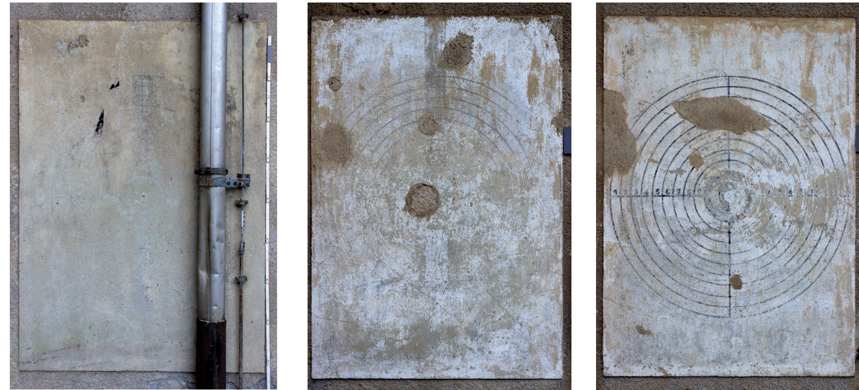
Abb. 2: Die Zielscheiben (circa 1,70m auf 1,20m) auf der westliche Hälfte der Nordwestfassade des Fabrikgebäudes. Für ein besseres Verständnis wurden die Zielscheiben nummeriert: eins (links), zwei (mitte) und drei (rechts).