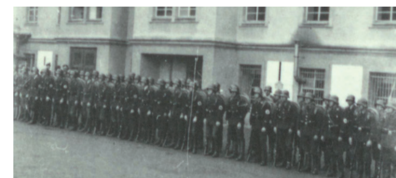
Abb. 3: Ausschnitt einer Aufnahme der Nordwestfassade des Fabrikgebäudes mit drei Zielscheiben im Hintergrund.

Bei den Zielscheiben handelt es sich grundsätzlich um drei hochformatige Scheiben aus Putz mit gemalten, schwarzen Zielringen. Auf dem materialsichtigen Fassadenputz des Fabrikgebäudes wurde ein einschichtiger hydraulischer Kalkputz als Fassungsträger aufgetragen und geglättet. Während auf den Fassungsträgern der zweiten und dritten Zielscheibe insgesamt drei Fassungen festgestellt werden konnten, sind auf der ersten Zielscheibe nur zwei Fassungen (1. + 3. Fassung) vorhanden. Ein metallischer Gegenstand im Zentrum der ersten Zielscheibe und Ritzungen in der weißen Grundierung der dritten Zielscheibe lassen eine Verwendung von Hilfsmitteln, möglicherweise einer Art Zirkel, für die Konstruktion der gemalten Zielscheibe vermuten.