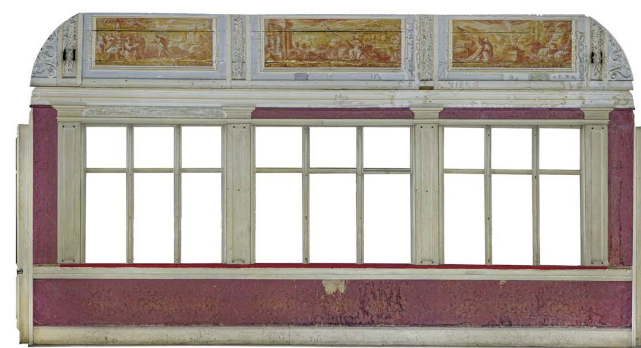
Gesamtaufnahme Ostwand mit Vertikalschiebefenstern