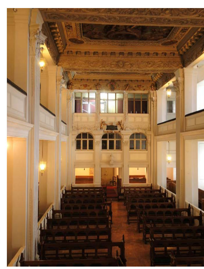
Ansicht der Schlosskirche nach Westen, Fürstenloge auf zweiter Empore