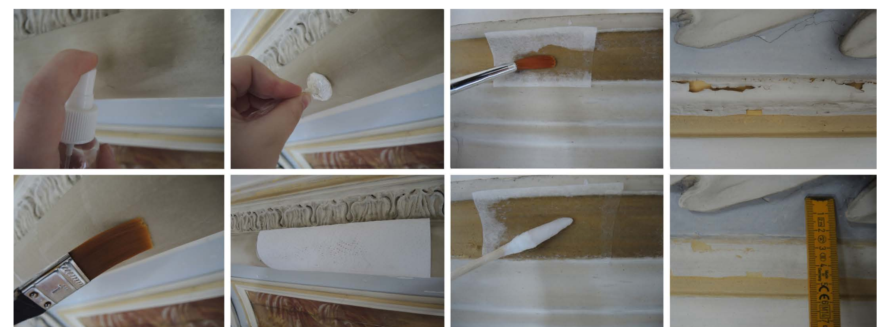
Vorgehen bei Festigung der Stuckfassung: Vornetzen, Japanpapierkaschierung und Festigung mit Pinsel, Andrücken, Kompressenbehandlung (von links oben nach rechts unten)

Die Deckengestaltung zeigte sich zu Beginn des Diploms in einem weitgehend guten und vollständigen Zustand. Erheblicher Handlungsbedarf bestand jedoch in extrem degradierten ockerfarbenen Bild- und Stuckfassungsbereichen. Außerdem konnten Risse und Brüche, Malschichtfehlstellen sowie Schweb- und Rußränder durch die Raumheizung und entsprechenden Kondenswasseranfall festgestellt werden. Die gesamte Deckengestaltung zeigte sich stark verschmutzt und auf dem Deckentondo zeichneten sich auffällige Vergrauungen ab.