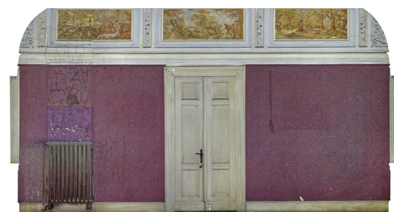
Gesamtaufnahme Westwand mit Füllungstür und Rippenheizkörper

und umgebender, floraler Stuckdekoration ausgestaltet. Die Gemälde stammen aus der Hand des Rudolstädter Hofmalers Seivert Lammers und behandeln im wesentlichen die Thronbesteigung Friedrichs der Zweiten sowie dessen herzogliche Tugenden. Den ausladenden Stuck fertigten die Eberswalder Brüder Samuel und Johann Peter Rust und nahmen darin durch die Verwendung der Chiffre »ff« ebenfalls Bezug zum Regenten.