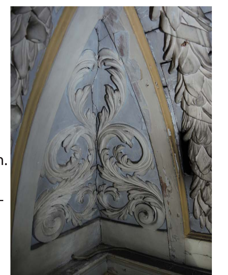
Akanthusranken Nord-Ost-Ecke vor der Reinigung (rechts) und nach der Reinigung (links)