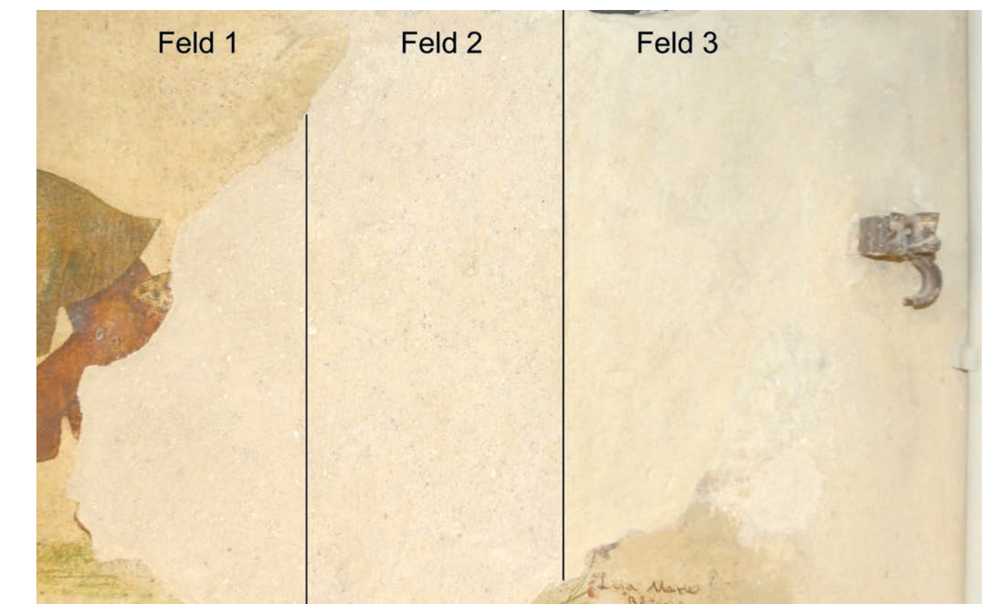
Integrierte Fehlstelle des Wandbilds 2. Feld 1 wurde mit einem eingefärbten Putz ausgeführt. Feld 2 mit einer Pigment-Wasser-Lasur und das dritte Feld mit einer eingefärbten Schlämme