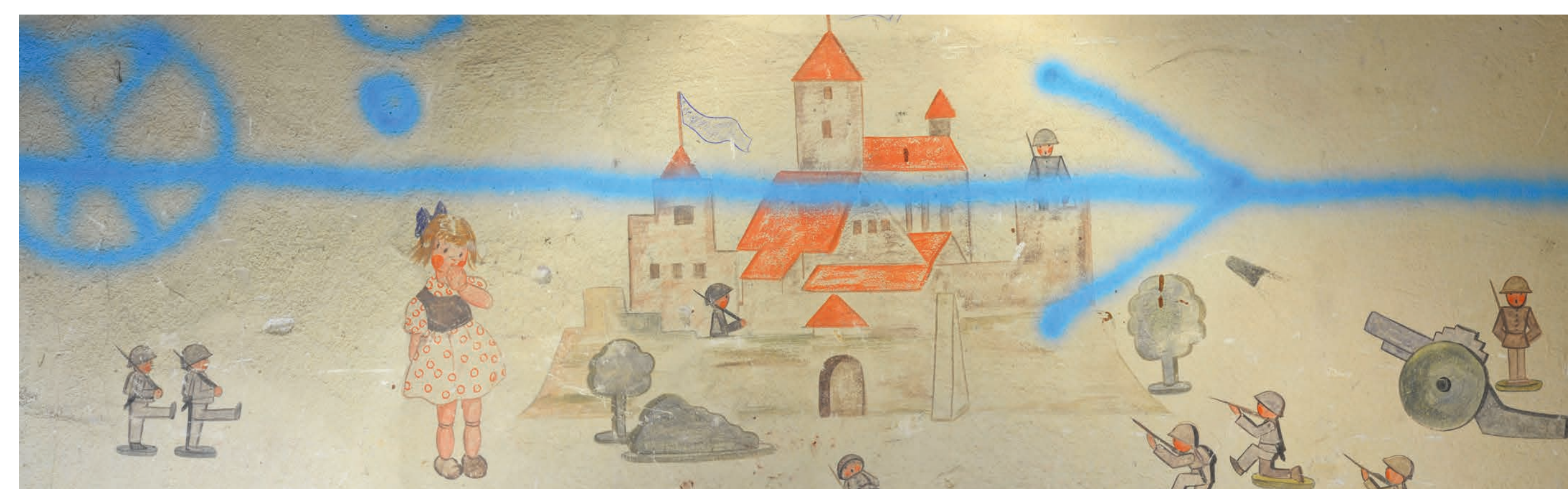
Wandbild 4 mit dem blauen Sprühmarkierungsstreifen