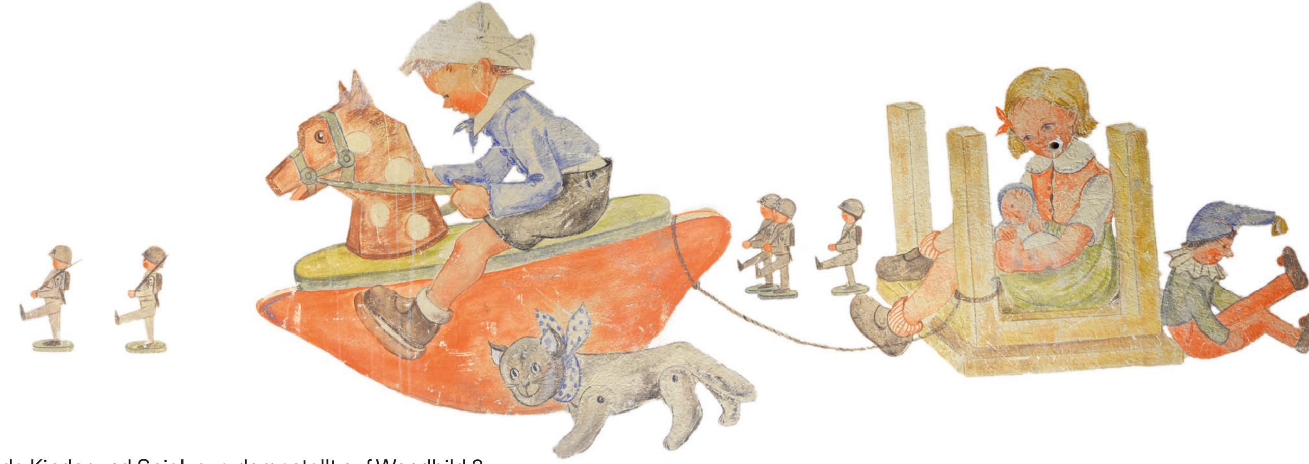
Spielende Kinder und Spielzeug dargestellt auf Wandbild 3

Dass überhaupt festgestellt werden konnte, dass es sich bei dem Luftschuttkeller um eine Anlage der Sonderaktion „Mutter und Kind“ handelt, ist den Motiven der Malereien in zwei der ehemaligen Schutzräume zu verdanken. Die insgesamt vier Wandbilder zeigen Zwerge oder von Spielzeug umgebende Kinder. Einige der Darstellungen lassen auch Rückschlüsse auf das damals vorherrschende Kriegsgeschehen zu. Auch trägt eines der Wandbilder die Signatur der Künstlerin: Lisa-Marie Blum.