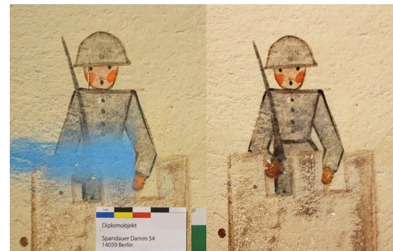
Zwischen- und Endzustand der Abnahme des blauen Sprühmarkierungsstreifens auf Wandbild 4