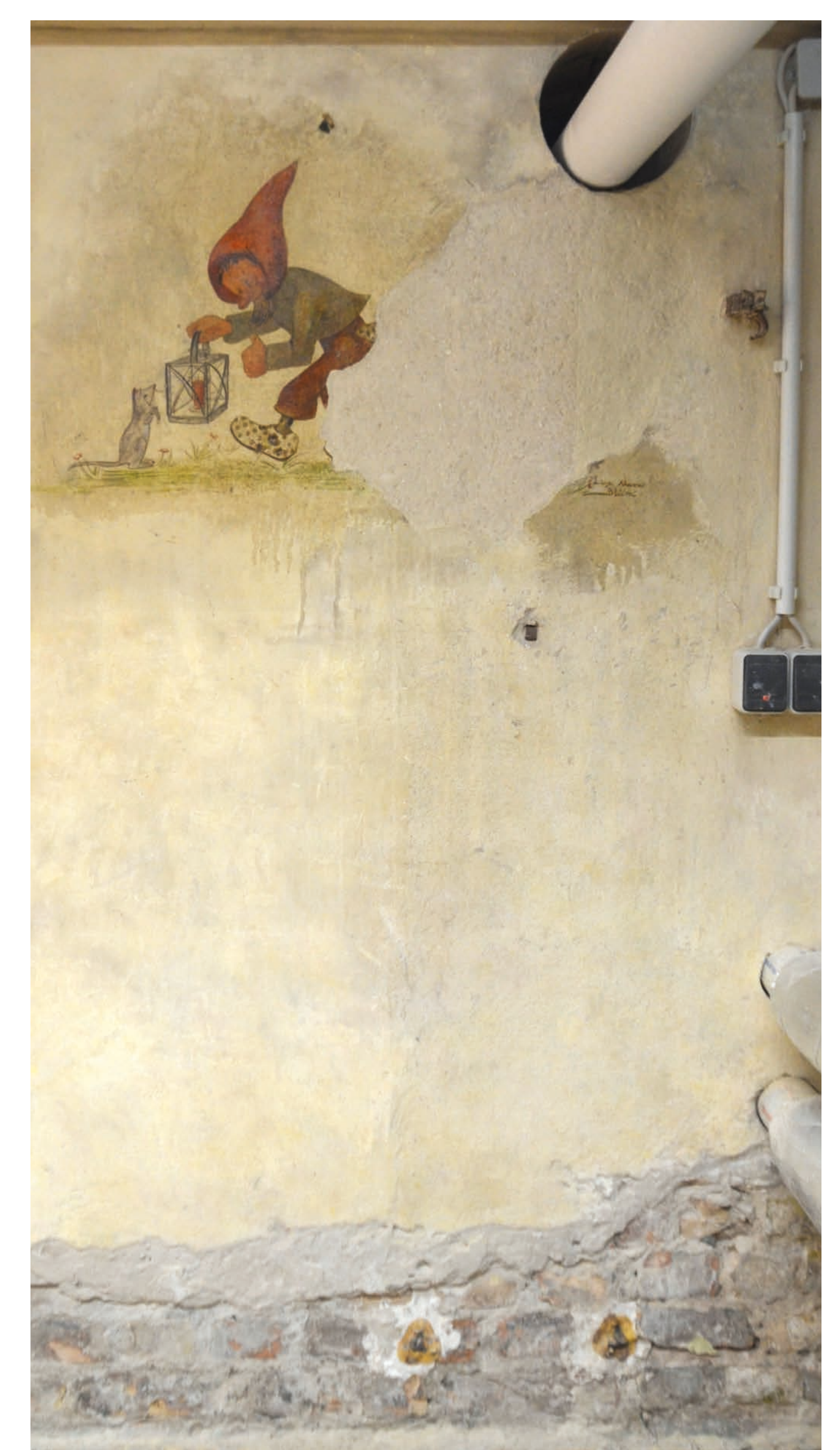
Endzustand der Musterachse des Wandbilds 2