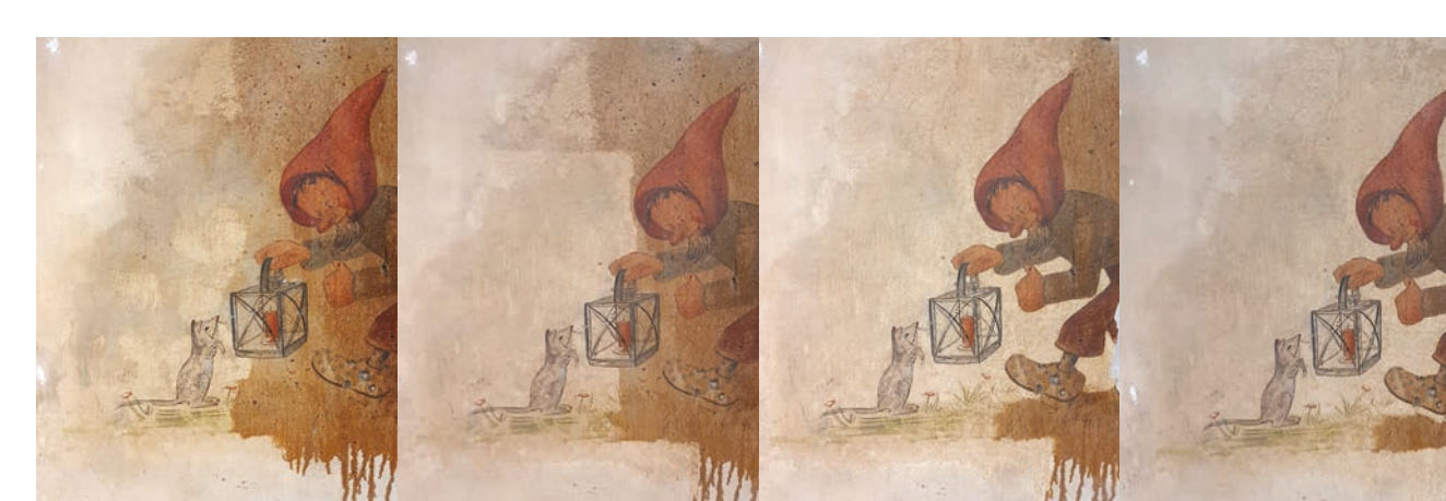
Prozess der Reduktion des Ölüberzuges am Wandbild 2

Weiterhin war es konservatorisch vordringlich, die Malerei vor weiterem Materialverlust zu bewahren. Eine Festigung aufstehender Farbschichten und die Konsolidierung destabilisierter Kanten von Abbrüchen wurden als notwendig erachtet. Zur Festigung und Wiederanlegen aufstehender Farbschichten wurde ein zweistufiges Konsolidierungsverfahren mit kohäsiver Festigung des Untergrundes angewandt, bevor die aufstehenden Bereiche adhäsiv niedergelegt werden konnten.