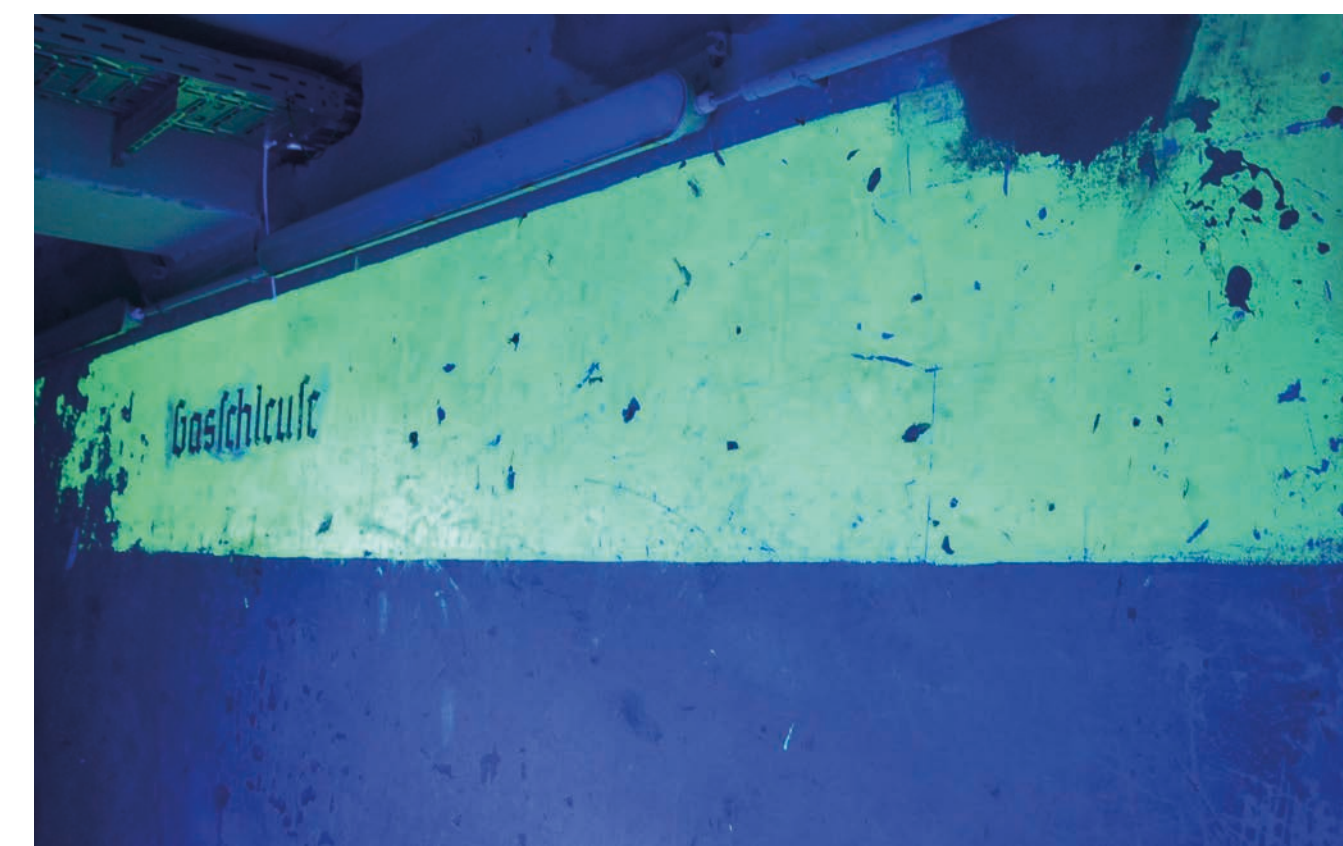
Kennzeichnung in Leuchtstofffarben unter UV-Strahlung