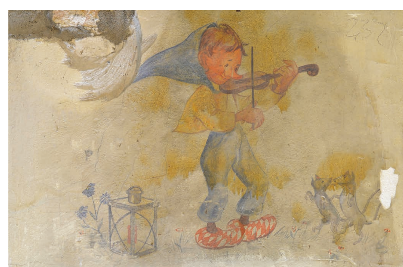
Wandbild 1 der Luftschuttkelleranlage am Spandauer Damm 54

Die verschiedenen Zustandsphänomene treten innerhalb einer Wandfläche in unterschiedlichem Ausmaß auf. Auch im Vergleich zwischen den einzelnen Wandbildern gibt es phänomenologische Beobachtungen, die sich auf einzelne Wandbilder beschränken. Durch die unterirdische Lage der Räumlichkeiten, einem geringen Flurabstand zum Grundwasser und das Vorhandensein bauschädlicher Salze, stellt Feuchtigkeit und damit einhergehende Phänomene ein konservatorisches, jedoch kontrollierbares Problem dar. Insbesondere später ergänzte Zementmörtelsockel im ersten Raum erweisen sich als eine Barriere für aufsteigende Feuchtigkeit.