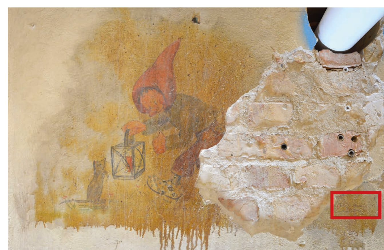
Wandbild 2 zeigt unten rechts der Fehlstelle die Signatur

Die dargestellten Motive der Wandbilder Aufgeteilt auf zwei Räume der Luftschuttkelleranlage befinden sich jeweils zwei Wandbilder in einem Raum. Die Wandbilder wurden von eins bis vier durchnummeriert. Die beiden kleineren Wandbilder des ersten Raumes zeigen Zwerge und kleine Mäuse.