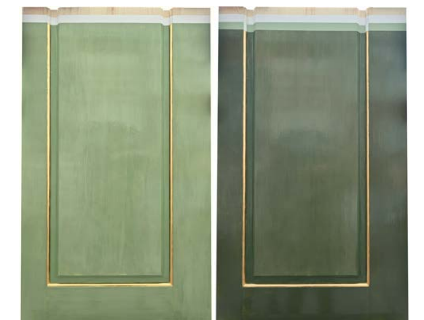
Endzustand beider Kassetten-Modelle

Die Stuckaturen wirken nach Abschluss der Arbeiten detailreicher und sind farblich wieder im harmonischen Einklang mit den heute stark verbliebenen Seidendamastbespannungen.