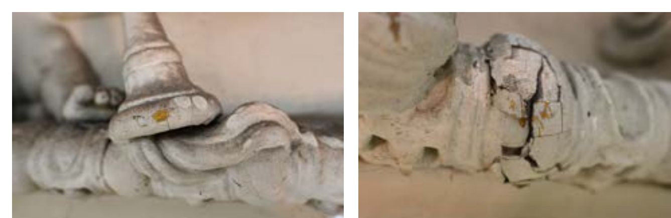
Kohäsive und Adhäsive Entfestigung im Deckenbereich

Die nutzungsbedingten Schadbilder, wie handwerklich bedingte Abrasionen und ausgebliebene Reinigungsmaßnahmen, prägen die Wahrnehmung des Raumes.