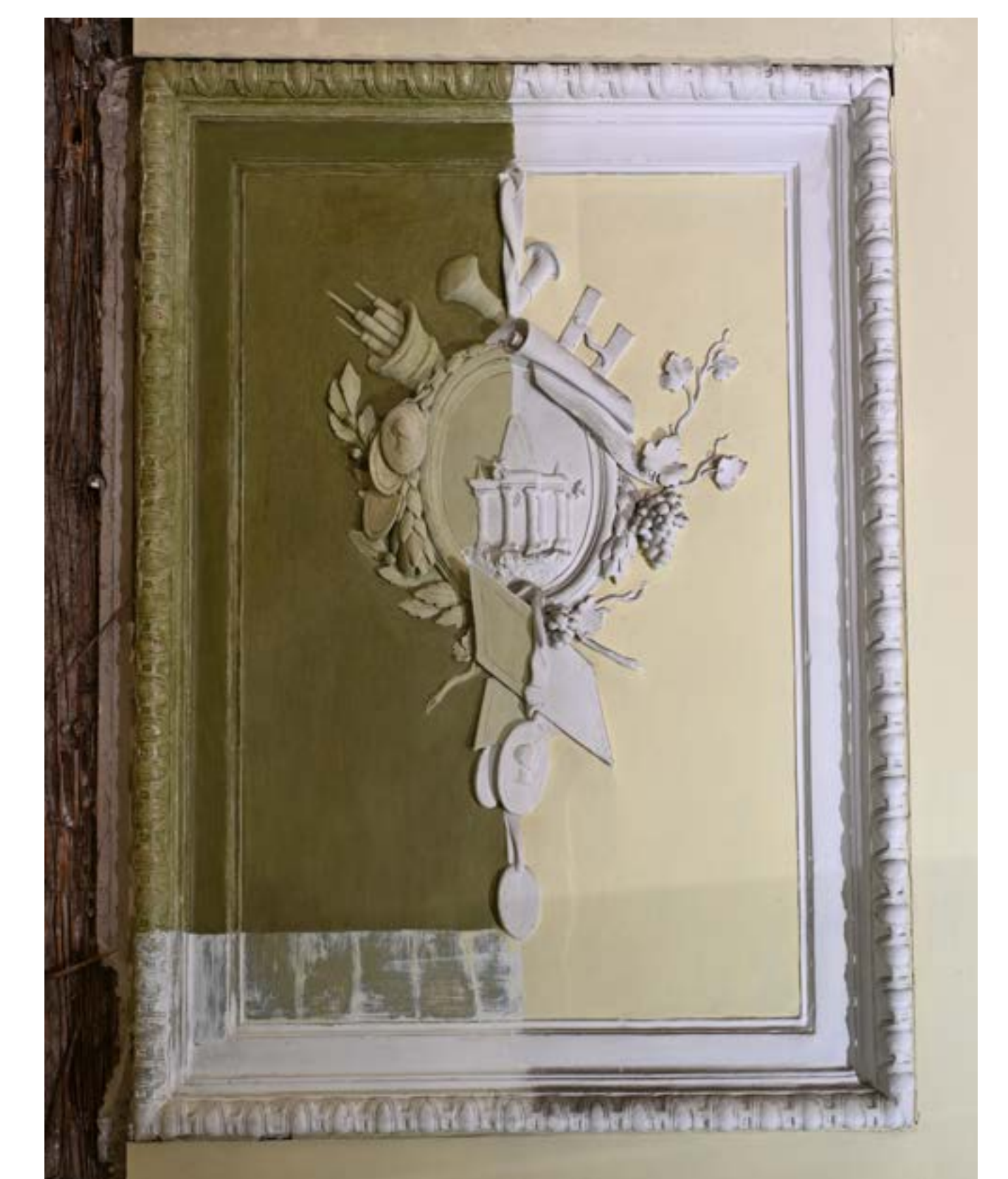
Endzustand der Musterfläche an der Supraporte

Nach Abschluss der Feinfreilegung folgte aufgrund der eingesetzten Alkalien eine Versiegelung der Oberfläche mit niedrigkonzentrierter Methylhydroxyethylcellulose. Der Glanzgrad konnte mit einem Mikrofaser- und Baumwolltuch vereinheitlicht werden. Das Nutzungskonzept sowie die festgelegte Präsentation der Raumschale trug maßgeblich zur Entscheidungsfindung des farblichen Integrationsgrades bei und führte zu dem Entschluss einer Vollretusche. Fehlstellen wurden mit einem Halböl-Kreidekitt geschlossen und anschließend mit öligen Temperafarben retuschiert.