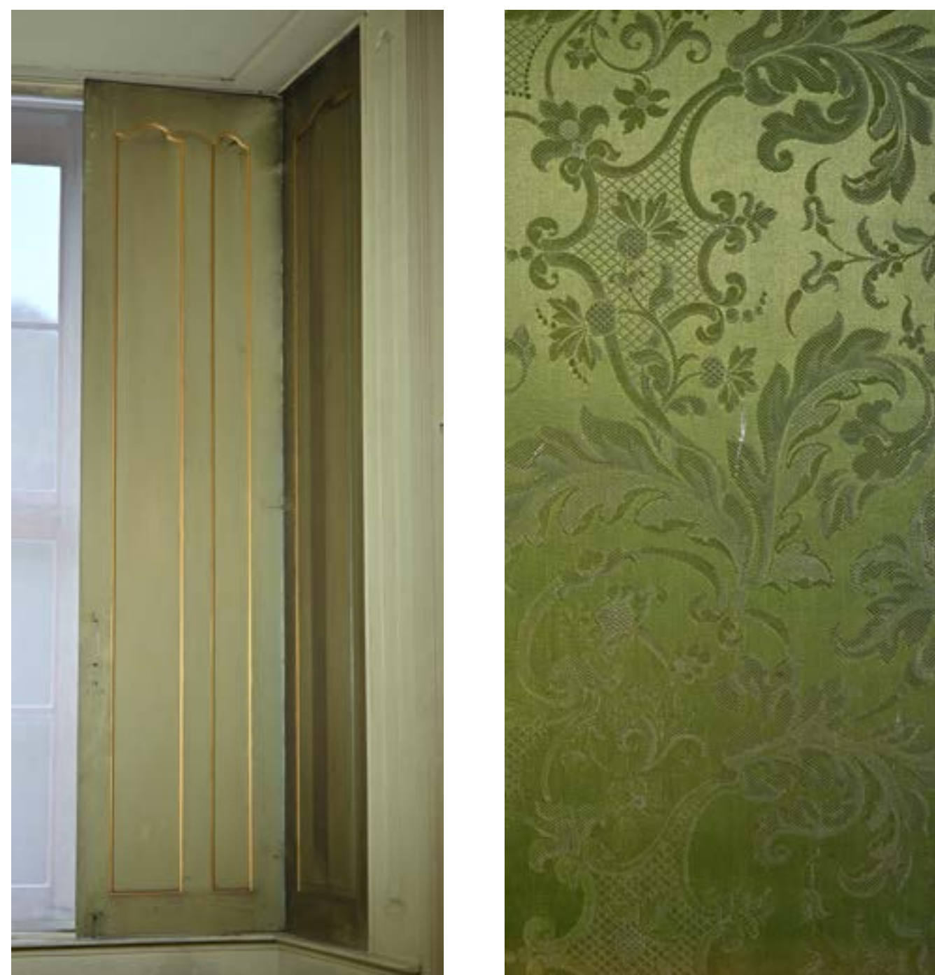
Geöffneter Fensterladen und textile Wandbespannung

Die Decken-, Supraporten- und Ofennischengestaltung sind die ältesten erhaltenen Bauteile aus dem Ende des 18. Jahrhunderts und werden als Spätwerk des fränkischen Stuckateurmeisters Bernhard Hellmuth betrachtet. Mitte des 19. Jahrhunderts folgte die heutige deckenhohe Schmucktäfelung nach Stüler mit integrierten grünen Seidendamastbespannungen von Louis Lenormand. Der Spiegel zwischen den Fensternischen stammt ursprünglich aus dem Schloss Hildburghausen und wurde im Zuge der Umnutzung auf Veranlassung Georg II. nach Meiningen transportiert. Das Tafelparkett ist aus dem Ende des 19. Jahrhundert. Die Bauteile zeigen in ihrer Struktur charakteristische Merkmale des Rokokos und aus dem Historismus stammende Gestaltungstechniken.