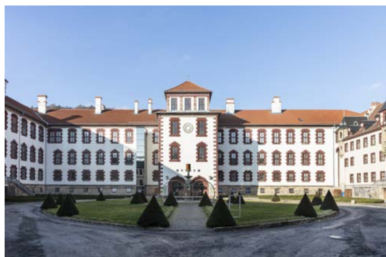
Museumseingang im Innenhof des Schlosses Elisabethenburg

Nicht nur die wechselnden Funktionen des Raumes, sondern auch politisch motivierte Ereignisse waren Gründe für die zahlreichen Überarbeitungen des historischen Bestandes, so dass sich der Einfluss dieser Eingriffe durch umfassende Schadensbilder zeigt. Das heutige stark neutralisierte Erscheinungsbild ist das Produkt der letzten Renovierung der 1950er Jahre. Von der einstigen hohen Ausstattungskunst und höfischen Pracht erzählt nur noch die Raumdisposition.