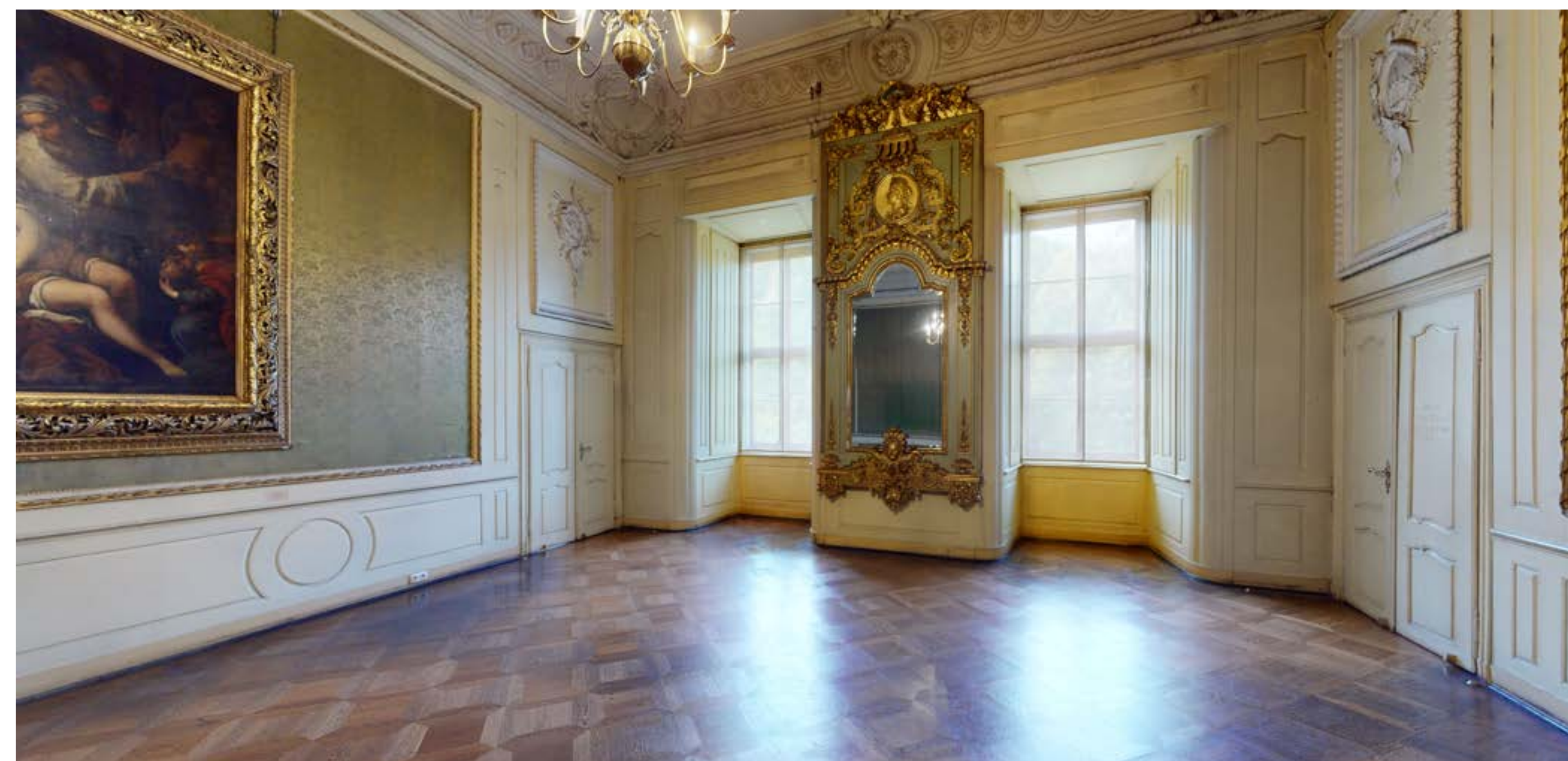
Heutiges Erscheinungsbild des Grünen Schlafzimmers

Die Kombination verschiedenster Kunstgattungen war charakteristisch für die Ausstattung herzoglicher Wohnsuiten. Das einstige Mobiliar und ihre kostbarsten Textilien vollendeten das Gesamtkunstwerk. Leider sind im Laufe der Zeit fast alle ursprünglichen mobilen Elemente verloren gegangen.