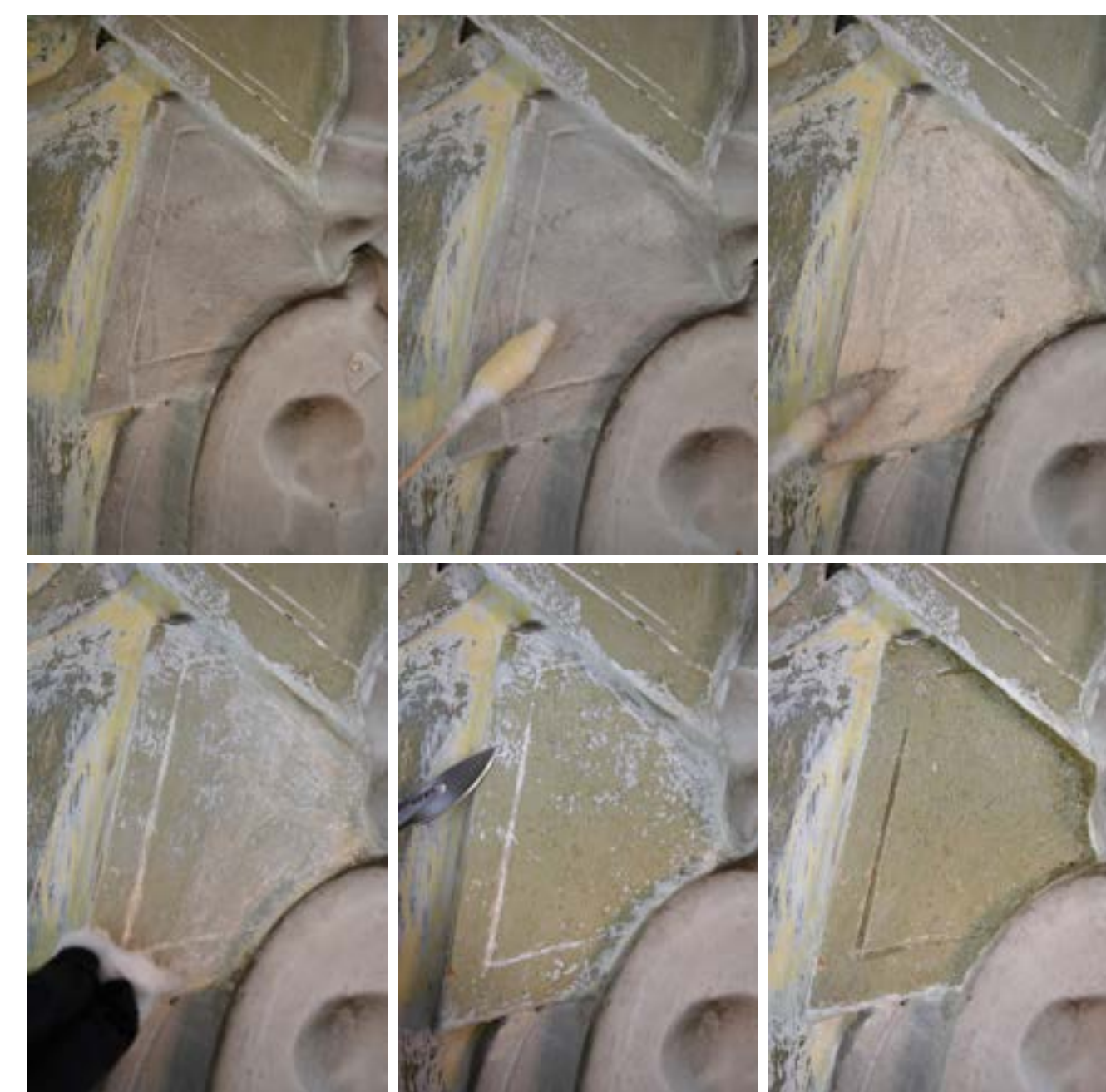
Arbeitsablauf der Freilegung mit Alkalischer Salbe

Die Erprobung gestaltete sich aufgrund der ähnlichen Löslichkeitsparameter der historischen Ölfarbschichten und der modernen Überfassung als schwierig. Etliche Lösungsmittelgemische konnten wegen der hohen Schichtstärke des Latex nicht tief genug reagieren, um die obersten Schichten anzulösen. Die Anwendung der Alkalischen Salbe stellte sich bei gründlicher Nachreinigung mit Wasser als substanzschonendste und effektivste Methode bei zeitgleich guten Oberflächenergebnissen heraus. Verbliebende Überreste des Latexanstriches konnten mit Hilfe einer Feinfreilegung mit Skalpell reduziert werden.