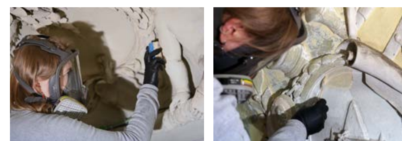
Aktionsaufnahmen während der Bearbeitung

Zur Maßnahmenkonzeption für die Konsolidierung und Reinigung der Stuckdecke zählt die verlustfreie Abnahme der Staubablagerungen bei zeitgleicher Festigung der stark gefügegeschädigten Bereiche. Die zu bearbeitenden Phänomene umfassen die kohäsiv und adhäsiv entfestigte Fassung sowie Bruchstellen der Stucksubstanz. Aufgrund der hohen Bleiweiß-Kontamination war im Rahmen der Diplomarbeit nur die theoretische Auseinandersetzung sowie eine punktuelle Erprobung ausgewählter materialkompatiblen Medien und Techniken vorgesehen. Die erfolgversprechendsten Lösungen zur Behandlung der Schadbilder wurden in der Maßnahmenenerhebung für eine zukünftige Restaurierung formuliert. Darunter findet man Maßnahmen zur Minimierung des Gesundheitsrisikos sowie für die Festigung von pudrigen Bereichen mit niedrigkonzentrierten Methylhydroxyethylcellulose. Eine vorherige Trockenreinigung mit Staubsauger und Pinsel sowie die Verwendung von Naturkautschuk ist nur bei stabilen Oberflächen zu empfehlen. Für die starren aufstehenden Fassungskonzepte erzielten Methylhydroxypropylcellulose die besten Ergebnisse. Hohlliegende Bereiche konnte durch eine temporäre Rissabdeckung und Injektion von PLM-A gesichert werden.